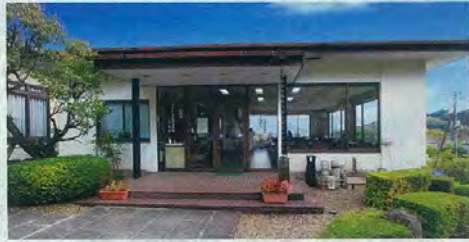
■所在地 / 埼玉県入間郡毛呂山町滝ノ入603番地 ■総面積 / 9,609㎡ ■施設 / 管理事務所、休憩所、法要施設、水道設備、駐車場ほか ■園地管理 / 宗教学法人行蔵寺

管理棟には、ゆったりと寛げる休憩スペース等、便利な施設を完備しております。また管理・運営する「行蔵寺」では、ご葬儀・ご法要・ご会食も行えます。（※使用条件あり）