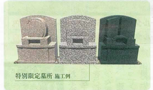
特別限定墓所 施工例

特別区 安心プラン 永久管理のお墓 この区画は、お客様の想いを自由にデザインできる区画です。さらに永久管理の安心プランも付けることができますので、万が一無縁になっても、お墓は撤去されず、この場所に永久に眠ることができます。 ※安心プラン（22万円【税込】）は別途となります。詳しくは現地係員にお尋ねください。